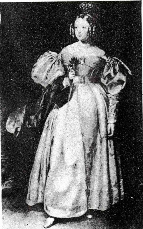
D. Maria II, rainha de Portugal

Quantos foram, ao todo, os tripulantes do caíque "Bom Sucesso", é quase uma incógnita, embora o n. 38 de "O Telégrafo Português", de 1809, num laconismo próprio da época, tenha informado que era 117, embora sem citar os respectivos nomes. Número elevado e, diremos mesmo, desnecessário, para tão pequena embarcação, obrigando ainda à sobrecarga de maiores suprimentos de água e mantimentos. Apesar